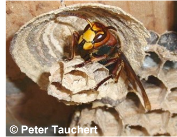
Anfangsneest einer Hornisse