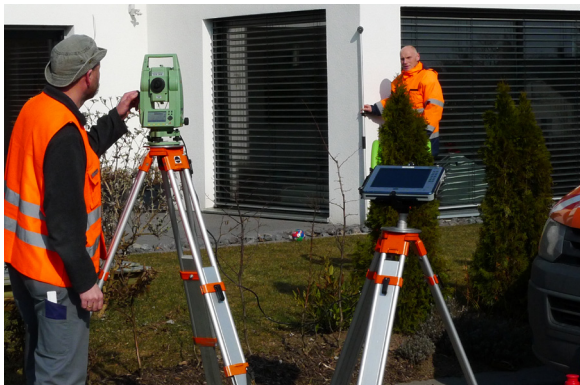
Einmessung der Lage des Gebäudes

Der Nachweis von Gebäuden im Liegenschaftskataster hat deshalb für den Eigentümer große Bedeutung.