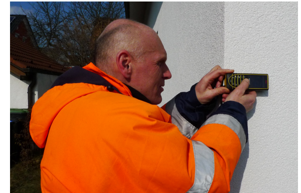
Ermittlung der Länge einer Gebäudeseite

Im Büro wird das Liegenschaftskataster daraufhin aktualisiert, damit die Angaben wieder auf dem aktuellen Stand sind.